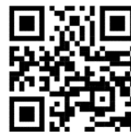
國際學生報名系統 International Student Application System