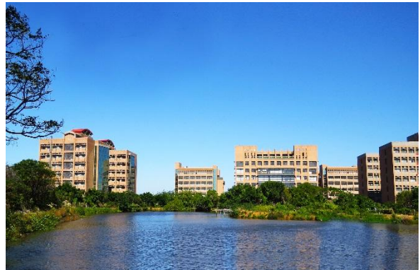
新竹校區 Hsinchu Campus