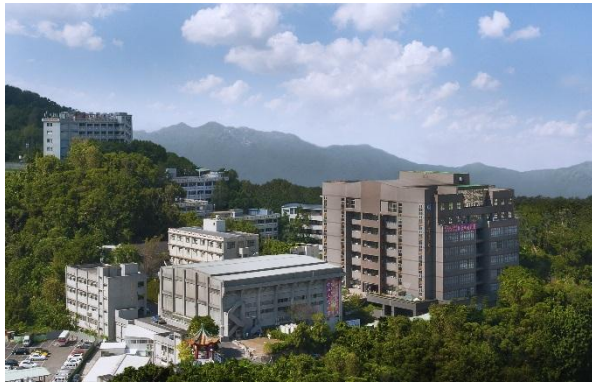
臺北校區 Taipei Campus